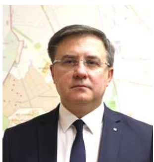
Глава администрации Пушкинского района Владимир Омельничский