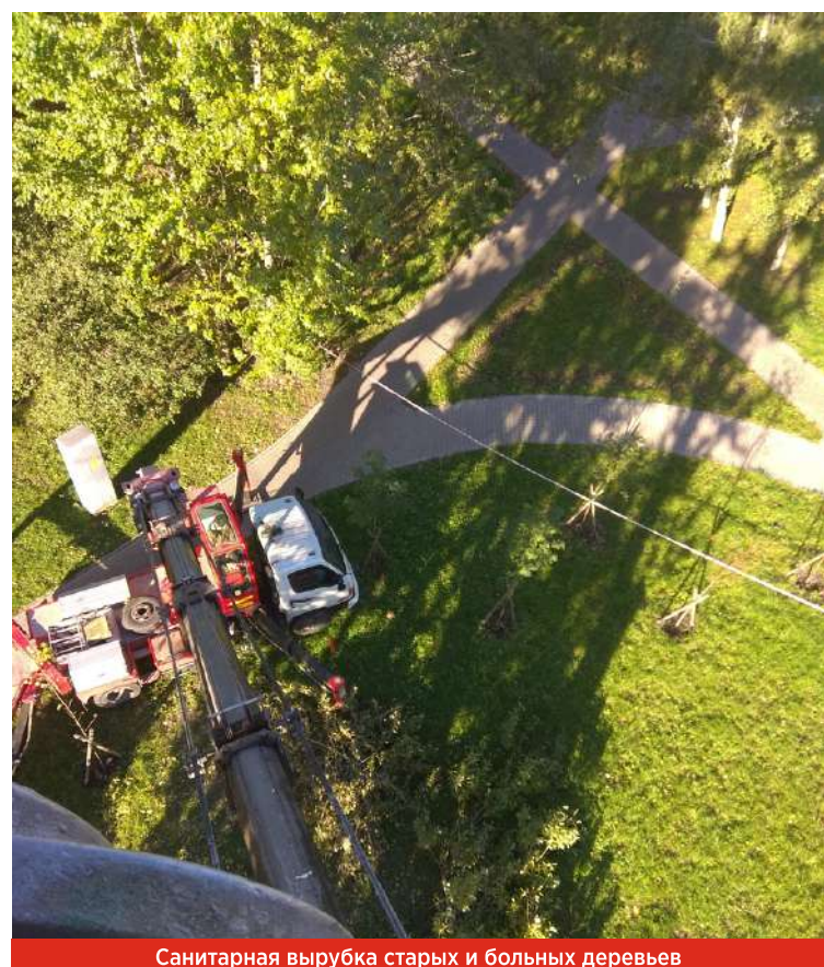
Санитарная вырубка старых и больных деревьев