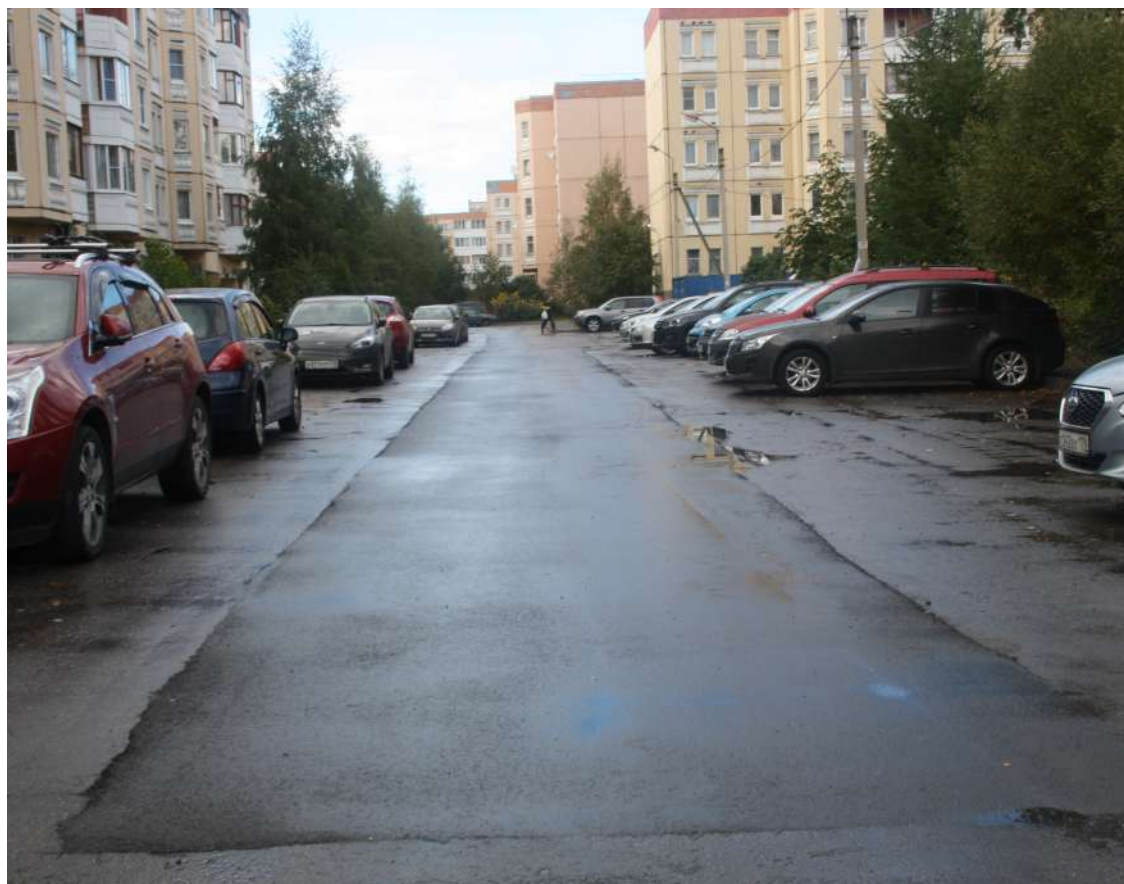
Устранение ям на дорогах большими участками оправдывает себя

- Внутриквартальными проездами занимается муниципалитет. Мы перешли на качественно новую технологию по программе ямочного ремонта. Ранее просто заделывали очередную яму и всё, но на следующий год рядом обычно образовывалась новая яма. Поэтому было решено менять сразу целые участки проезда – от поребрика до поребрика. Это оправдало себя: мы видим, что хотя уже года два у нас растут затраты на это, участков-то всё больше, но зато это куда более долговечная дорога получается. Скажем, напротив центральной площади в пос. Шушары и дома по Первомайской, 5 всегда была яма. Мы поменяли наконец целый пласт дороги вместе с ней – и ничего