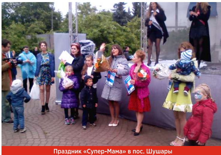
Праздник «Супер-Мама» в пос. Шушары

- Осталась последняя, одна из любимых экскурсий жителей - «Новогодний Петербург», она вскоре пройдет. Точная дата зависит от того, как скоро в городе закончатся приготовления к празднику. Петербург очень красив в эти дни: люди гуляют, веселятся, и участники экскурсии невольно заряжаются этим праздничным настроением. Сумма в бюджете МО на экскурсии определяется в конце года, а в начале следующего на комиссии по культуре депутаты определяют основные направления, куда жители могли бы поехать, и даты, составляется график экскурсий. Традиционно поездки планируются в теплое время года, с апреля