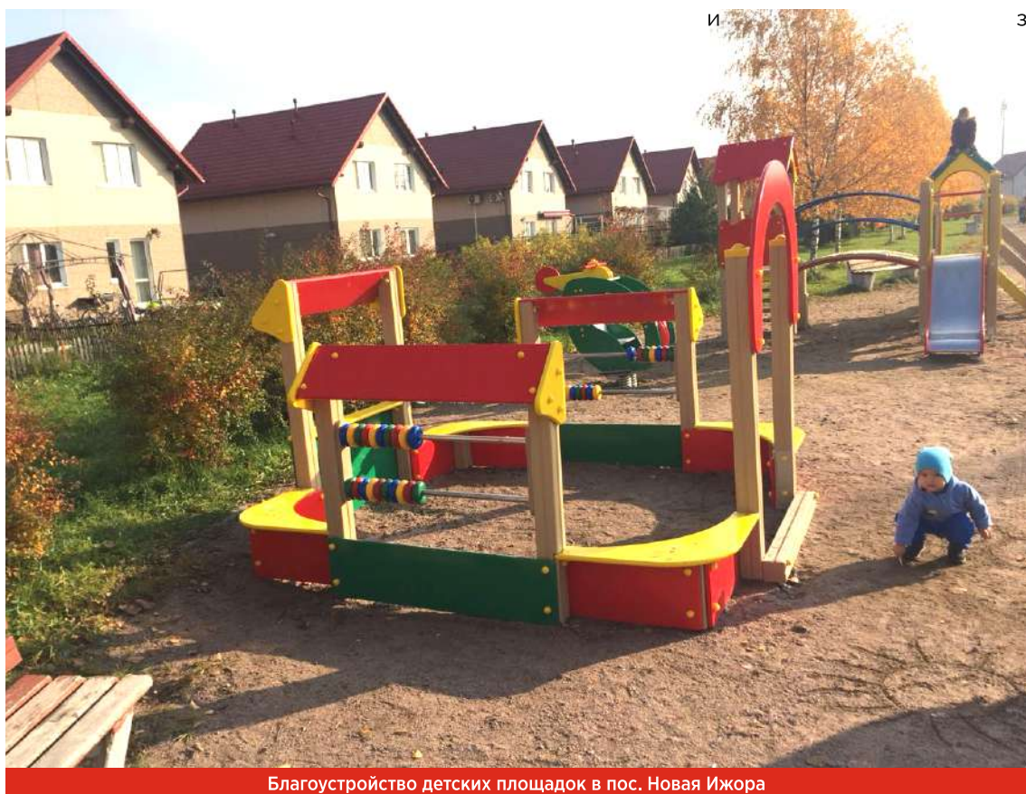
Благоустройство детских площадок в пос. Новая Ижора

- В ходе проектирования мы учитываем все или большинство пожеланий местных жителей. Мы собираем дворовые собрания и слушаем всех пришедших жителей. Предположим, одни хотят песочницу или качели, другие – новую пешеходную дорожку или еще что-то. Это очень важно, местным жителям видны те вещи, о которых мы и не подозреваем. Все эти вопросы, чего именно хотят жители, мы должны выяснять в самом начале процесса, чтобы проект был одобрен всеми сторонами, и жи-