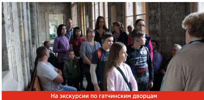
На экскурсии по гатчинским дворцам

Особое внимание в нашей работе мы уделяем блокадникам и «детям блокады». В