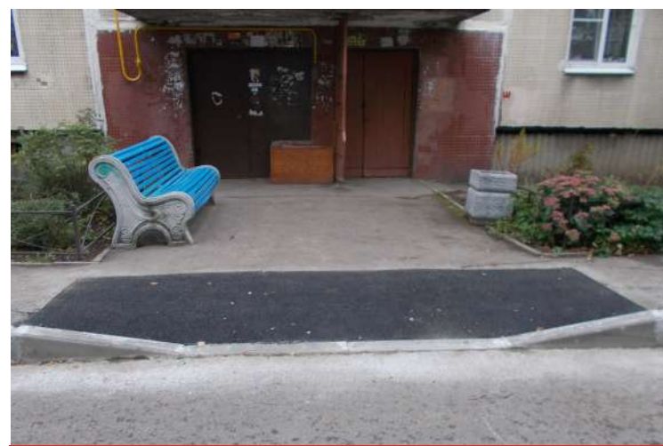
После занижения бордюрного камня

- Да, есть большая программа по оформлению территорий, поселков и микрорайонов к празднованию Нового Года. В 2019 году на это мы выделяем почти 3 млн рублей. Вешаем консоли, устанавливаем новогодние ели с украшениями, каждый год ремонтируем прежние консоли. Периодически закупаем новые елки, их постоянно ломают, от вандализма никто не застрахован. Всё это украшение поднимает жителям настроение, рождает ощущение настоящего праздника.