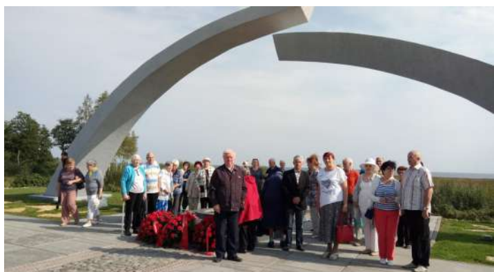
Экскурсия шушарцев к памятнику «Разорванное кольцо» на Ладоге

В целом в 2019 году муниципалитет выделяет на все культурные программы порядка 20 млн рублей, по сравнению с прошлыми годами 14 миллионами. У нас постоянно прирастает территория, обустроятся новые земли, участки, увеличивается поступление налогов - растет и бюджет на культурно-досуговые мероприятия.