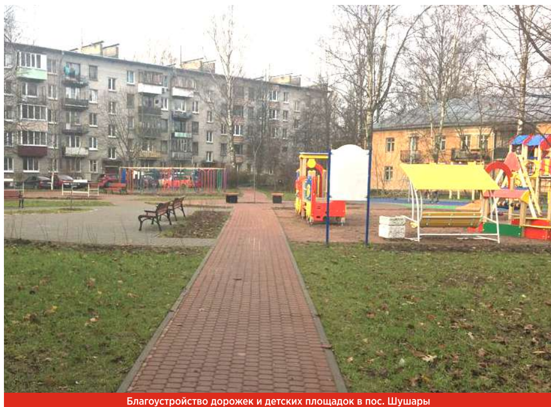
Благоустройство дорожек и детских площадок в пос. Шушары

В 2019 году завершим замену старого детского оборудования в п. Новая Ижора. Там 4 года у нас ушло, чтобы заменить всю рухлядь, доставшуюся нам от «Балтроса».