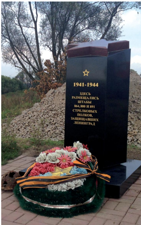
Пулковское шоссе, 2-й км.