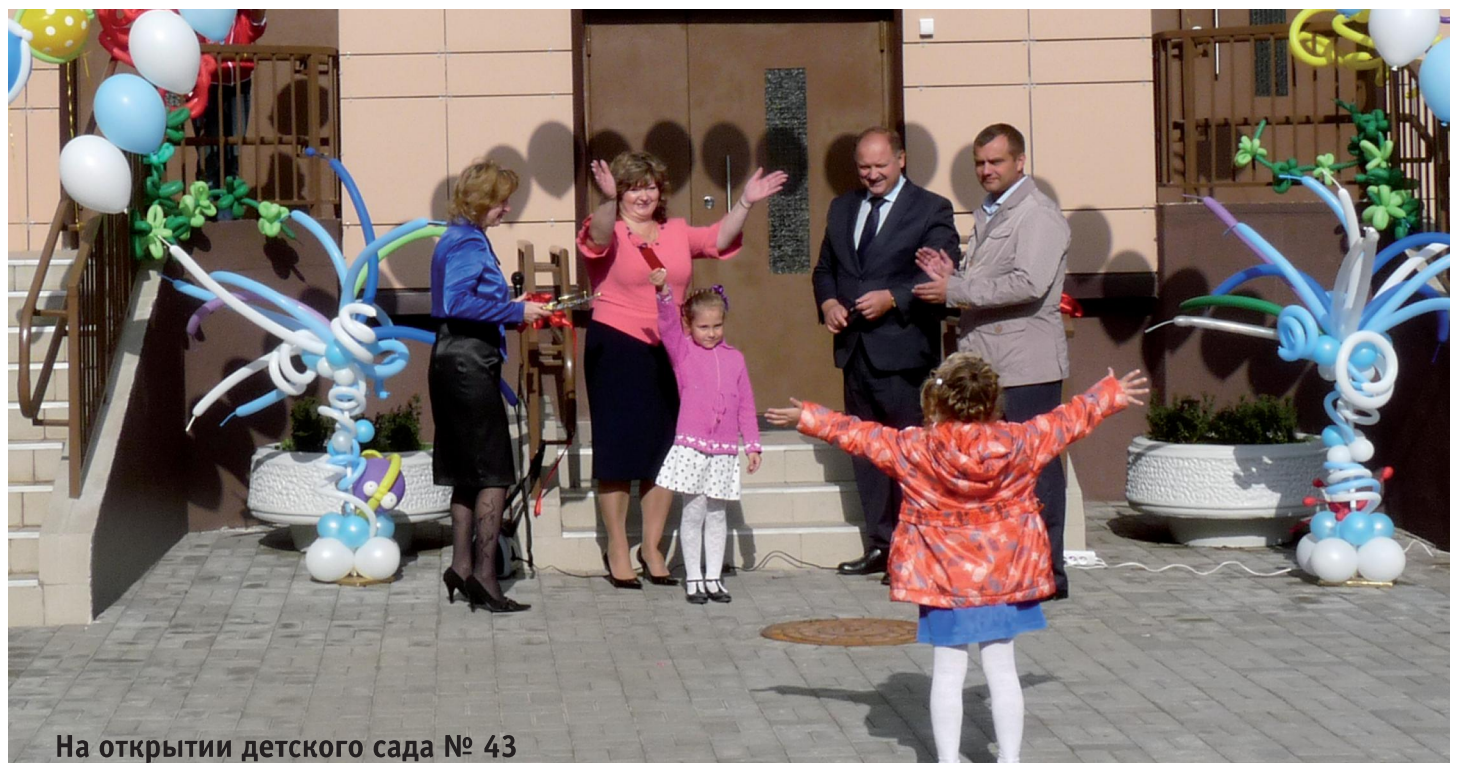
На открытии детского сада № 43

Пресс-служба администрации Пушкинского района Фото предоставлено отделом образования администрации Пушкинского района