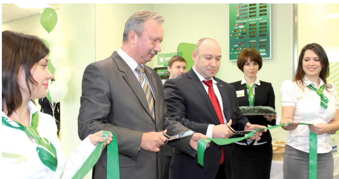
Торжественный момент перерезания ленточки

РЕЖИМ РАБОТЫ: понедельник–суббота: с 10.00 до 20.00, без перерыва на обед, вос- кресенье: выходной.