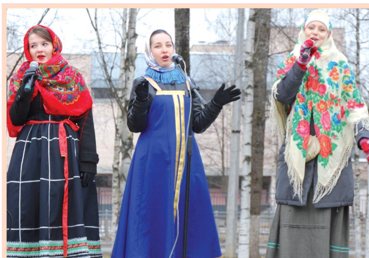
Праздник в п. Детскоесельский