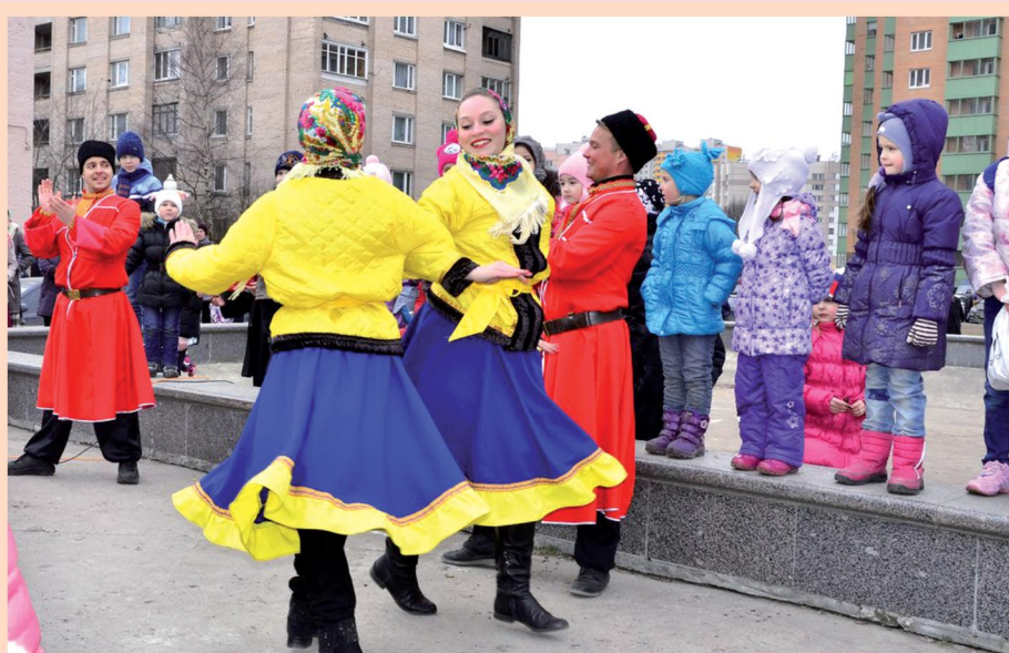
Народные гулянья в п. Шушары