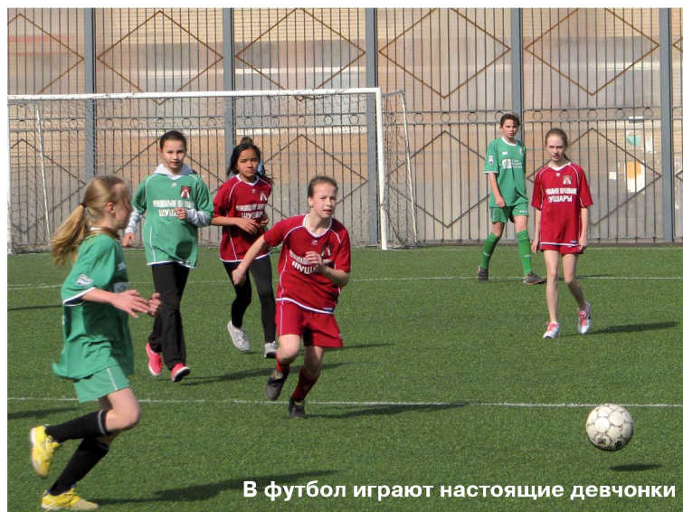
В футбол играют настоящие девчонки