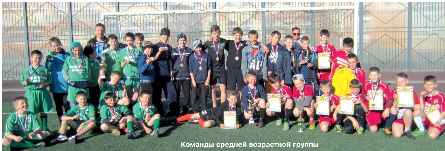
Команды средней возрастной группы