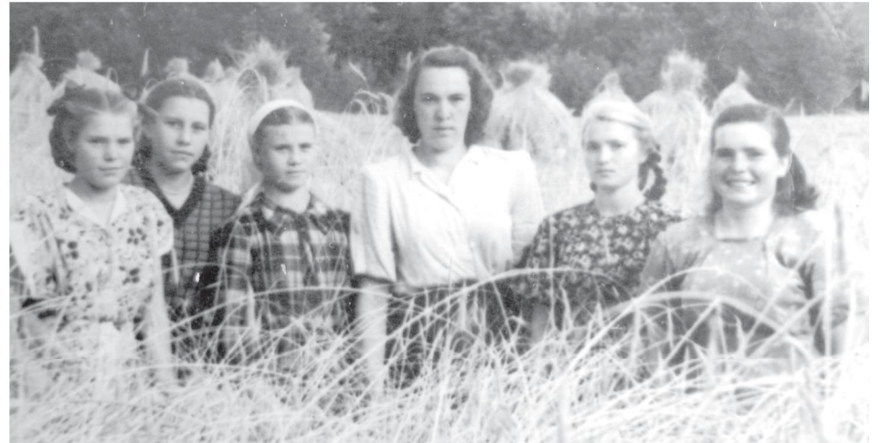
Вместе с воспитанницами детдома на уборке урожая

родительскую после войны не восстановила, и даже льготы как блокадница не получает, так как из-за детей, работы, внуков ей все было не до сбора документов. А сохранившаяся сегодня информация – весьма противоречива: некоторые источники утверждают, что в 41-м ее эвакуировали в Ярославскую