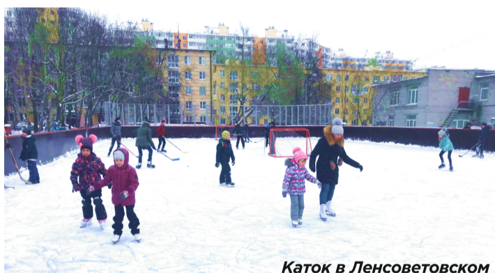
Каток в Ленсоветовском

Для более подробной и оперативной информации подпишитесь на группы в